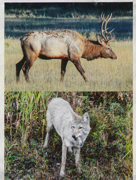
Abb. 1 Gerieten direkt unter Druck: Wapiti und Kojote.

In den 1960er- und 1970er-Jahren begann das Verständnis für ökologische Zusammenhänge und so auch für die Rolle von Grossraubtieren zu wachsen. 1973 wurde in den USA der Endangered Species Act erlassen, bis heute eines der wichtigsten nationalen Gesetze zum Schutz gefährdeter Arten. Damit ergab sich die Verpflichtung, lebensfähige Populationen von in den USA gefährdeten und bereits lokal ausgestorbenen Arten zu fördern, und für den Grauwolf wurde der Yellowstone und seine Umgebung als eines der Schlüsselgebiete bestimmt.