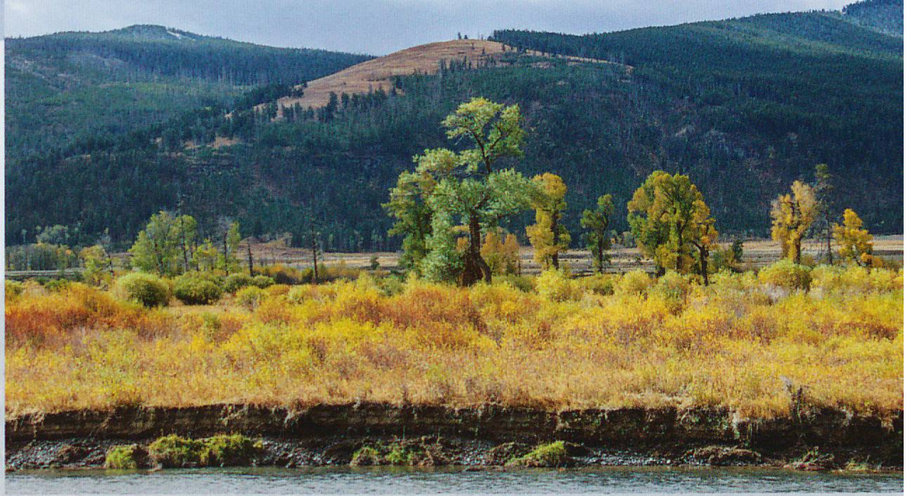
Abb. 2 Laubbäume im Lamar Valley im Norden des Yellowstone-Nationalparks verjüngen sich wieder.