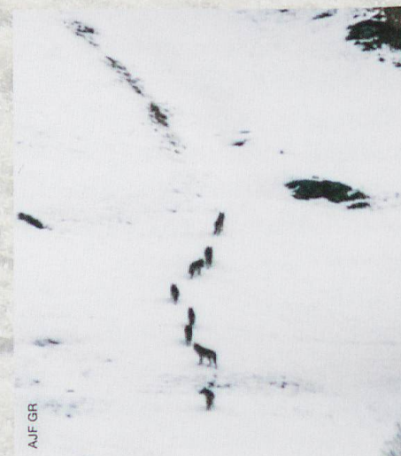
Abb. 1 Das Calanda-Rudel zählt seit 2012 immer zwischen 8 und 11 Wölfe.

Aus den 6 Würfen 2012–2017 konnten von den über 40 beobachteten Welpen 35 genetisch identifiziert werden. 21 Jungtiere waren männlich und 14 weiblich. Die genetische Identifikation der einzelnen Individuen