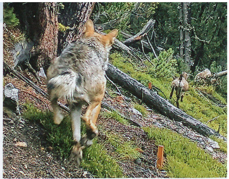
Abb. 3 Ein eindrückliches Fotofallen-Dokument: Wolf und flüchtende Junggämse bei Grimmels (SNP), 31. August 2018

Spannend ist der Vergleich der Rissfunde mit Wolfsskot bzw. mit den darin befindlichen Rückständen (siehe Rückseite). Für die Auswertung standen 25 Proben zur Verfügung, die zwischen Januar 2017 und März 2018 fast alle im SNP gesammelt und von Felice Puopolo mikroskopisch analysiert worden sind: Rothirsch, Reh oder Gämse waren in 21 Proben (84 Prozent) vertreten, und in 18 Proben (72 Prozent) wurden ausschliesslich eine oder zwei dieser drei Arten nachgewiesen. Weitere Nahrungsbestandteile bezogen sich auf Kleinsäuger, Insekten, Pflanzenteile/Beeren sowie Hundefutter (in 2 Proben, wohl von Jagdständen für die Fuchsjagd). Sogar Plastik wurde in einem Kot nachgewiesen. Unter den Huftieren war auch hier der Rothirsch am häufigsten vertreten, die Gämse lag leicht vor dem Reh. Unter Berücksichtigung, dass innerhalb des SNP Gämsen gegen-