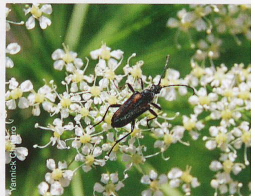
Abb. 2 Der Gelbbraune Kugelhalssbock Acmaeops pratensis bewohnt bevorzugt Nadelwälder hoher Lagen. Er wurde im Lärchen-Arvenwald mit Fichten auf 2000 m ü.M. nachgewiesen.