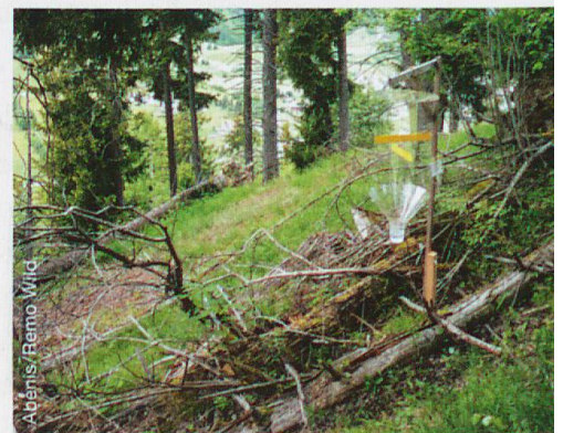
Abb. 1 Fallentyp Polytrap 3 im Fichtenwald und Naturwaldreservat Ils Crippels

Für die Erhebung positionierten Forschende zusammen mit dem lokalen Forstdienst Käferfallen in möglichst unbewirtschafteten und totholzreichen Waldpartien, welche die im Tal vorhandene Diversität der Wälder bestmöglich abdecken. Die Erhebung fand in 5 Waldtypen und an 7 Standorten statt (Abb. 1). Um Käfer mit unterschiedlichsten Lebensweisen einzufangen, wurden pro Standort je 3 Flugfensterfallen 1,5 Meter über dem Boden sowie eine Falle im Kronenbereich angebracht. Diese Fangmethode ergänzten Bierfallen im Auenwald, Terpentinfallen im Nadelwald und Handfänge in allen Waldgebieten. Auf diese Weise konnten im Sommer 2018 744 Arten aus 60 verschiedenen Käferfamilien nachgewiesen werden. Bei rund 500 Käferarten war es der erste Nachweis in der Val Müstair. Für rund ein Drittel aller Käferarten ist Totholz in unterschiedlichster Form wie beispielsweise Dürrständer an besonnten Standorten, Totäste an noch lebenden Bäumen oder liegende, fast vermoderte Stämme lebensnotwendig. Weitere 10 Prozent der Käferarten nutzen Totholz ebenso als Lebensraum, können aber auch ohne dieses überleben.