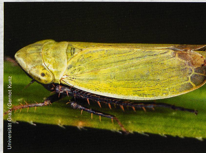
Abb. 3 Die schwarzgrüne Graszirpe ist eine der häufigsten Zikadenarten, die auf SNP-Weiden vorkommt.

Zur Gemeinschaft der Invertebraten auf SNP-Weiden gehören nicht nur Herbivoren, sondern auch Prädatoren (Raubtiere) wie Spinnen, Omnivoren (Allesfresser) wie Ameisen und Destruenten (Zersetzer) wie Asseln (Abb. 1). Letztere konsumieren abgestorbene Pflanzenteile oder tote Tiere. Der Ausschluss der pflanzenfressenden Säugetiere beeinflusste auch diese komplexen Gemeinschaften. Vor allem Prädatoren profitierten davon (Abb. 1), weil ihre Beute, die Herbivoren, häufiger wurden. Gleichzeitig behinderte die nach Ausschluss der Säugetiere dichter gewordene Pflanzendecke sehr bewegliche Prädatoren bei der Futtersuche. Jene Laufkäfer beispielsweise, die bei der Jagd auf ihre Augen angewiesen sind, konnten in dichter Pflanzendecke ihre Beute viel schlechter erspähen und verfolgen. Sie wurden folglich durch den Hirschausschluss seltener.