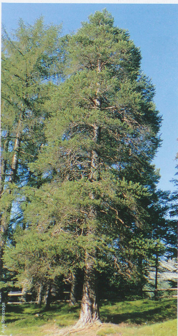
Engadinerföhre Pinus sylvestris var. engadinensis