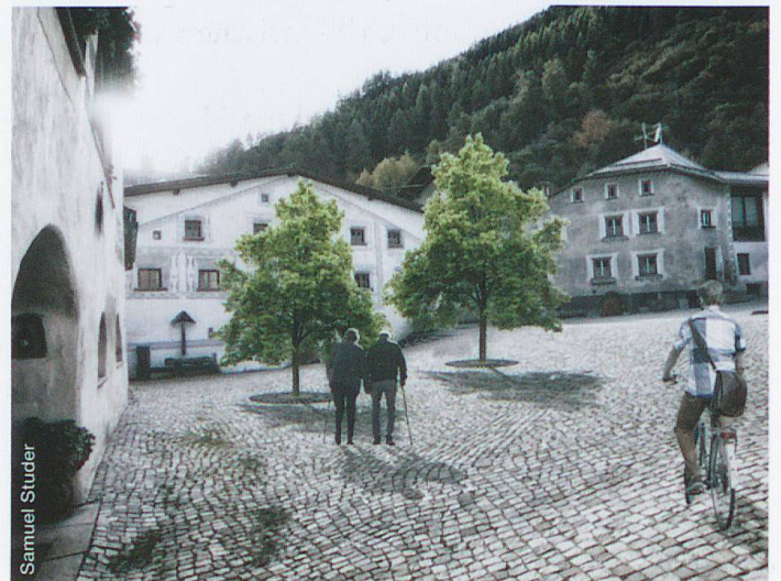
Planungsillustration für den neuen Dorfkern von Müstair