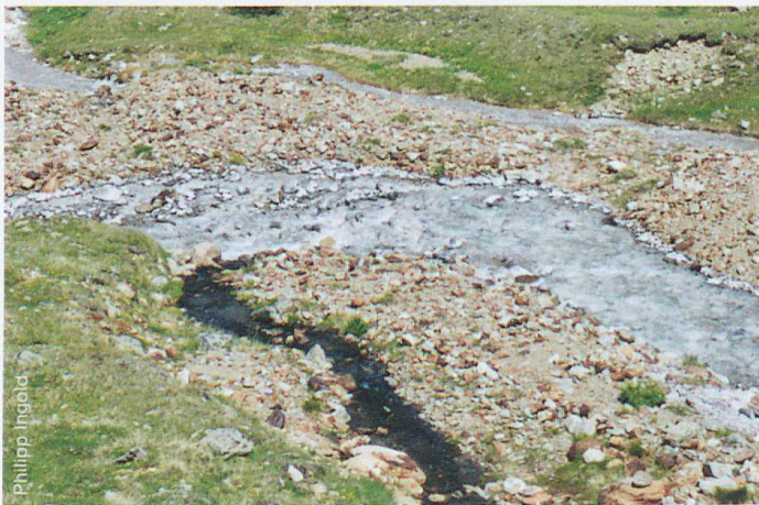
Die Steine der Aua da Prasüra weisen seit dem Jahr 2000 weisse «Basaluminit-Ränder» auf.

Basaluminit ist ein schneeweisses Aluminium-Schwefel-Mineral. Es ist dafür bekannt, dass es gelöstes Arsen binden und so dem Wasser entziehen kann. Dies macht es interessant für die Trinkwasseraufbereitung. Leider ist Basaluminit in pH-neutralem Wasser nicht stabil. Zusätzliche Forschung soll die potenzielle Nutzung als Filtermaterial weiter klären. Mithilfe von Fällungsreaktionen durch pH-Erhöhung wird Basaluminit im Labor synthetisch gebildet. Vorkommnisse