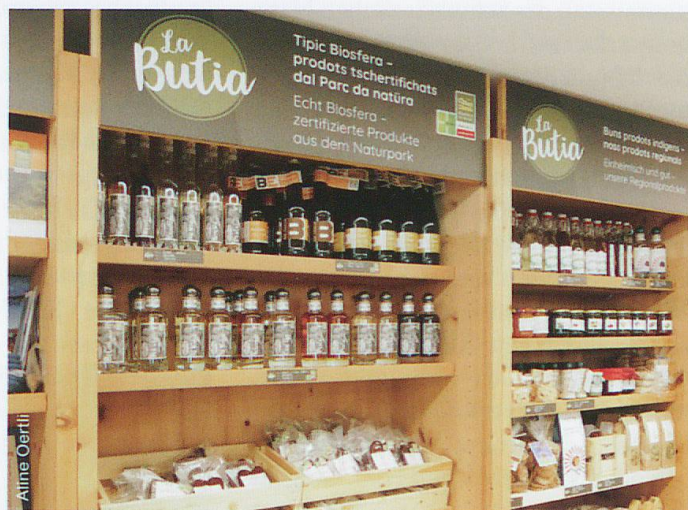
Dorfladen (Butia) von Valchava

Sensibilisierung für Wildruhezonen geachtet werde. Zweifel an der Nachhaltigkeit beinhalten die Auswertungen zum Ausbau des Skigebiets Minschuns. Lokale Baustoffe und erneuerbare Energie wie der Bau der Feriensiedlung oder der Betrieb des Skilifts sollten stark gewichtet werden. Damit können einerseits Arbeitsplätze geschaffen oder zumindest erhalten