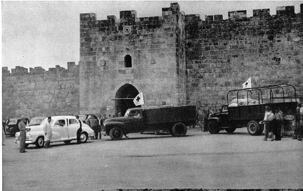
Jerusalem (Altstadt). — Lastwagen fahren aus der Herodespforte in die Neustadt (31. August 1951).