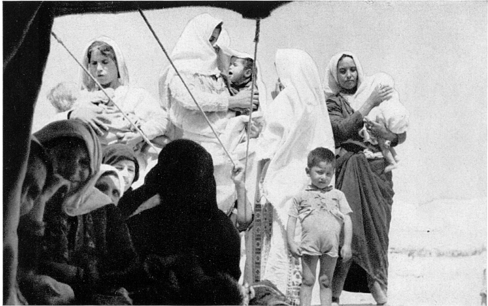
Betreuung von Flüchtlingen aus Palästina. Jericho. Vor der Poliklinik.