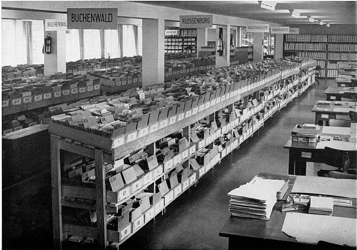
Une partie de l'immense fichier.