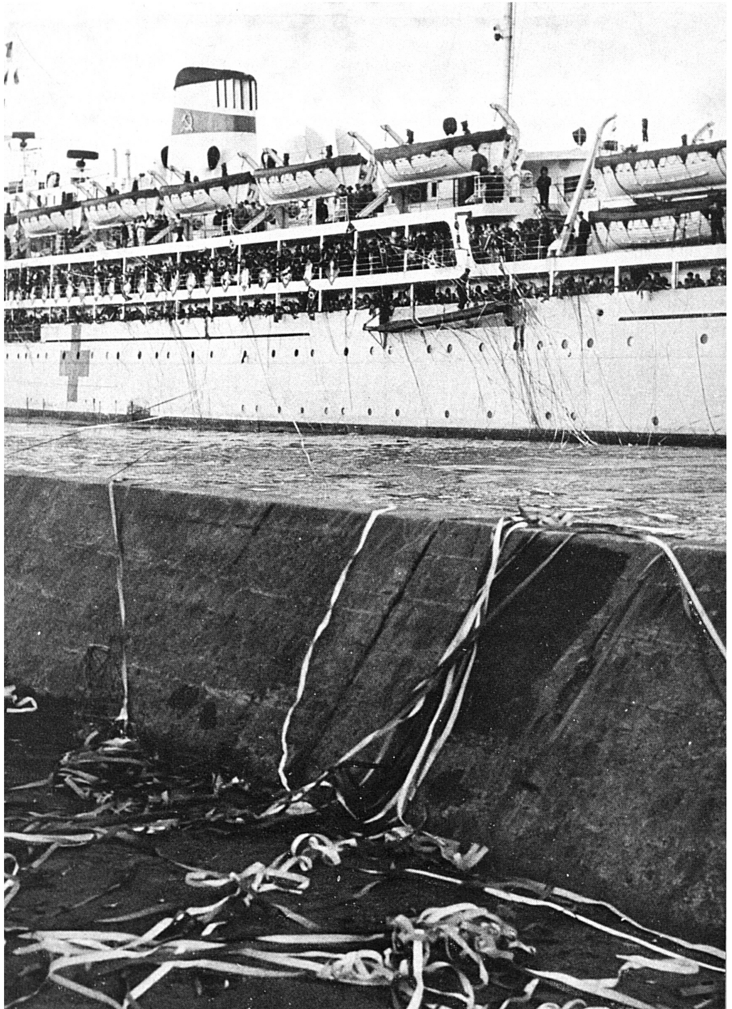
Niigata (Japon) : rapatriement de Coréens. Archives CICR