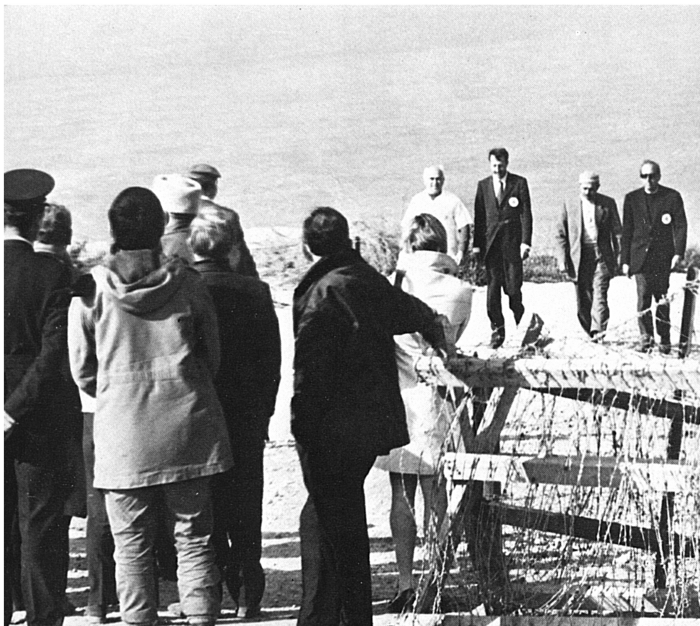
Rapatriement d'un interné civil à la frontière israélo-libanaise, le 28 février 1971.