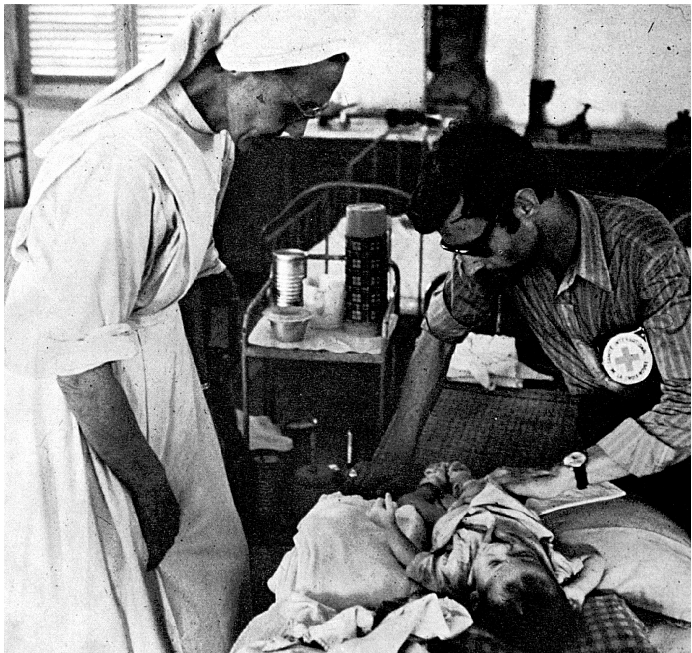
Un délégué-médecin du CICR visite un orphelinat à Saïgon.