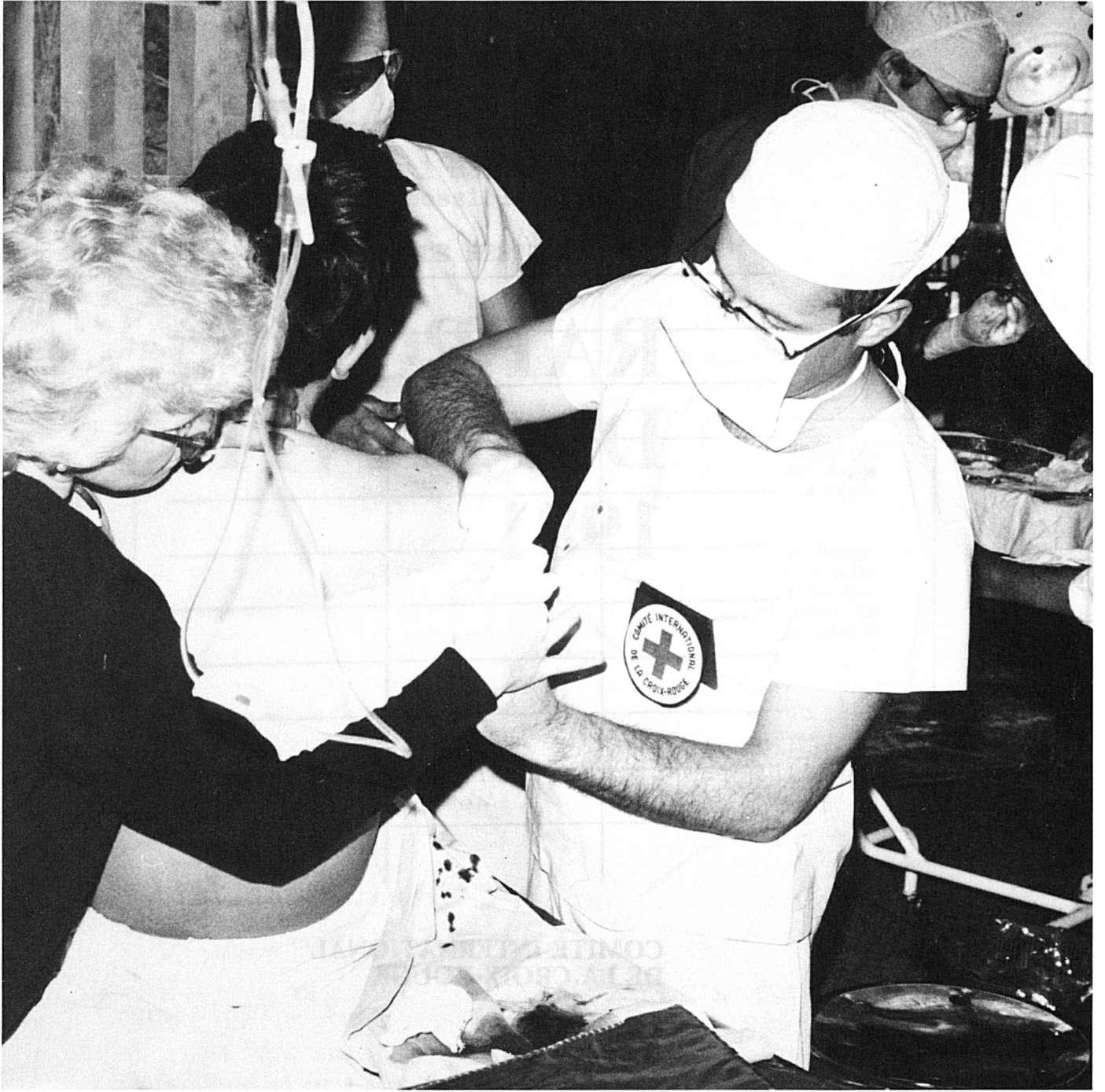
Intervention chirurgicale à l'hôpital du CICR à Peshawar (Pakistan), où sont traités des Afghans, civils ou combattants, victimes des affrontements à l'intérieur de l'Afghanistan.