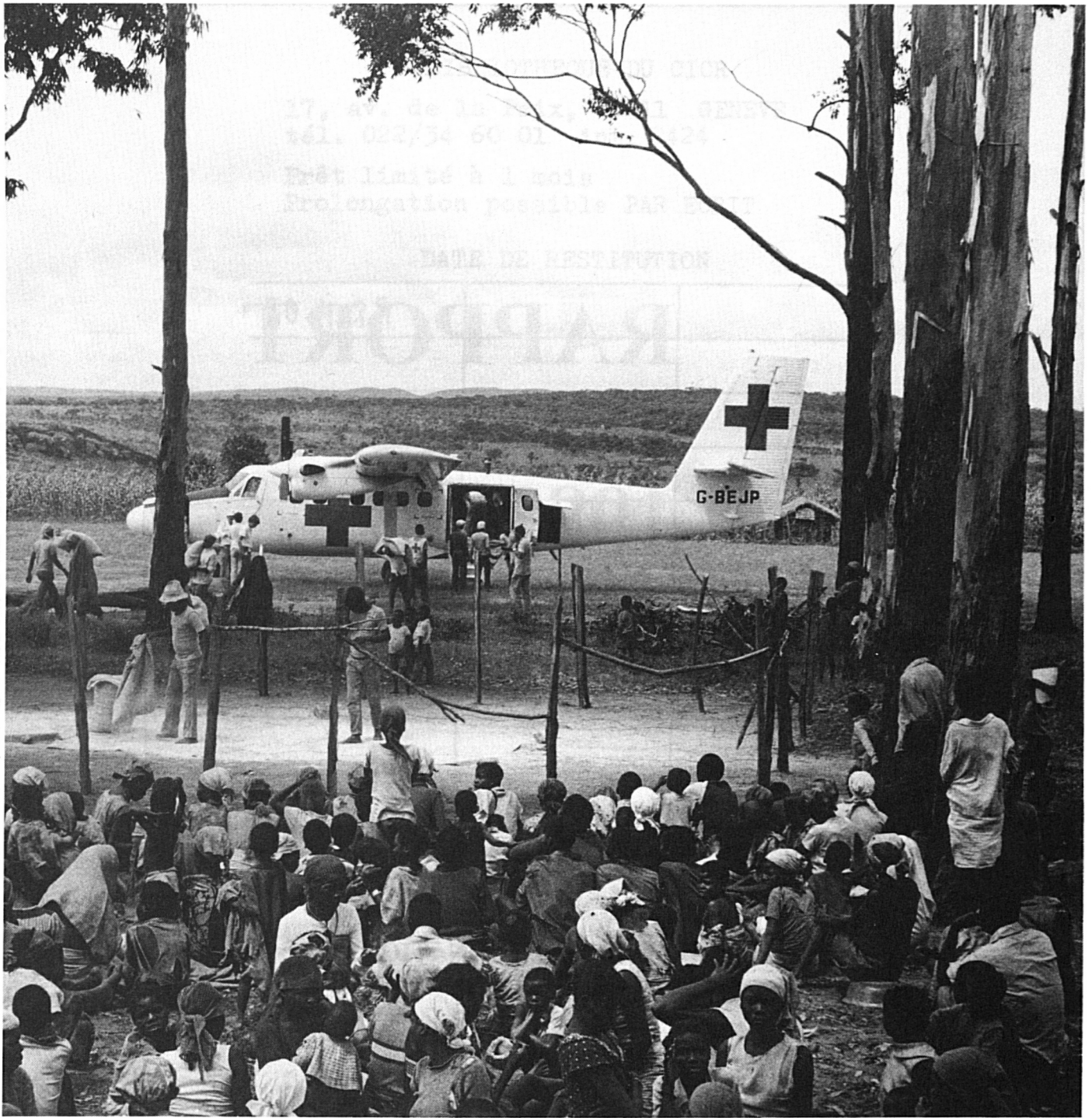
Approvisionnement, par avion CICR, d'un village de la région de Bailundo, en Angola.