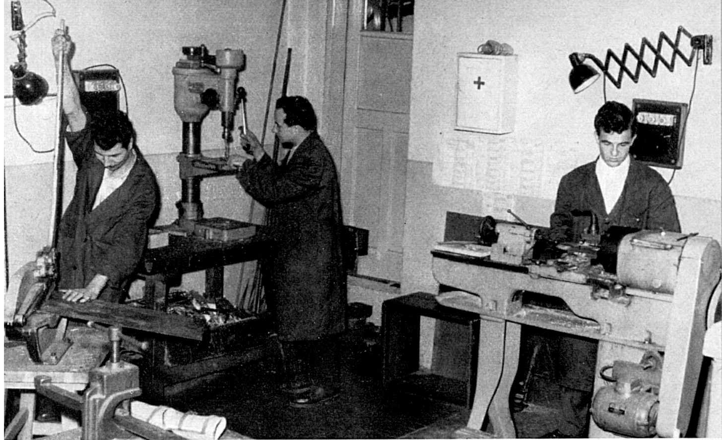
YUGOSLAVIA Taller de prótesis, en Sarajevo.