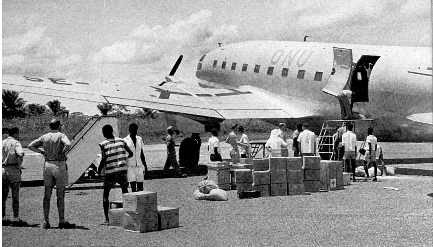
CONGO Un avión de las Naciones Unidas, puesto a la disposición del CICR y convoyado por un delegado, descarga víveres y medicamentos destinados al hospital de Gemena.