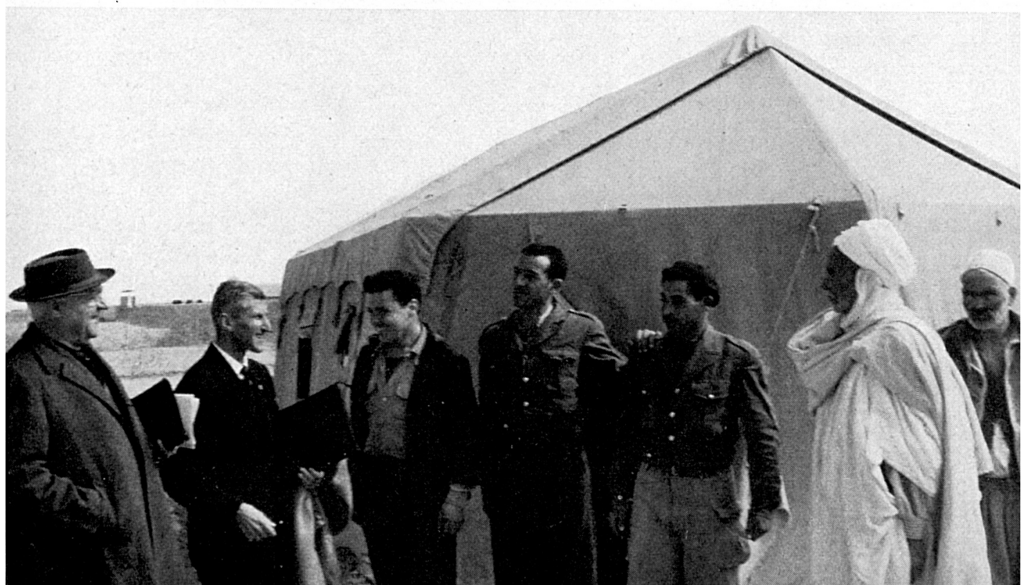
ARGELIA En el centro de escogimiento y de tránsito de Barika.