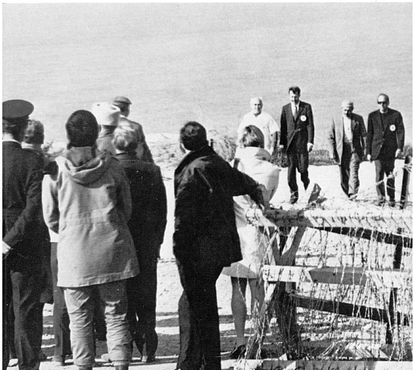
Rapatriación de un internado civil en la frontera israelolibanesa, el 28 de febrero de 1971.