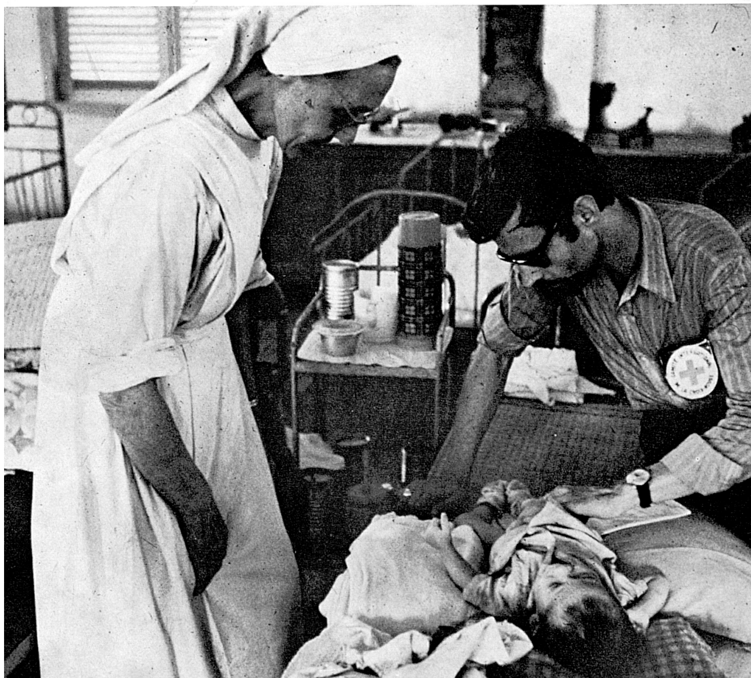
Un delegado médico del CICR visita un orfanato de Saigón.