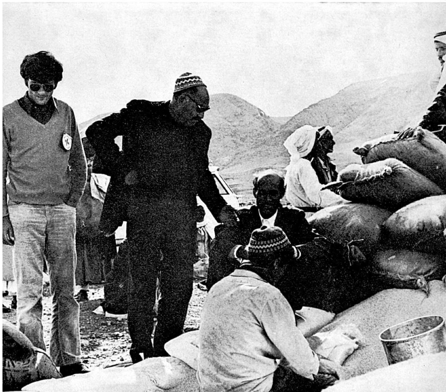
Distribución de víveres, en el Sinaí, a beduinos desplazados.