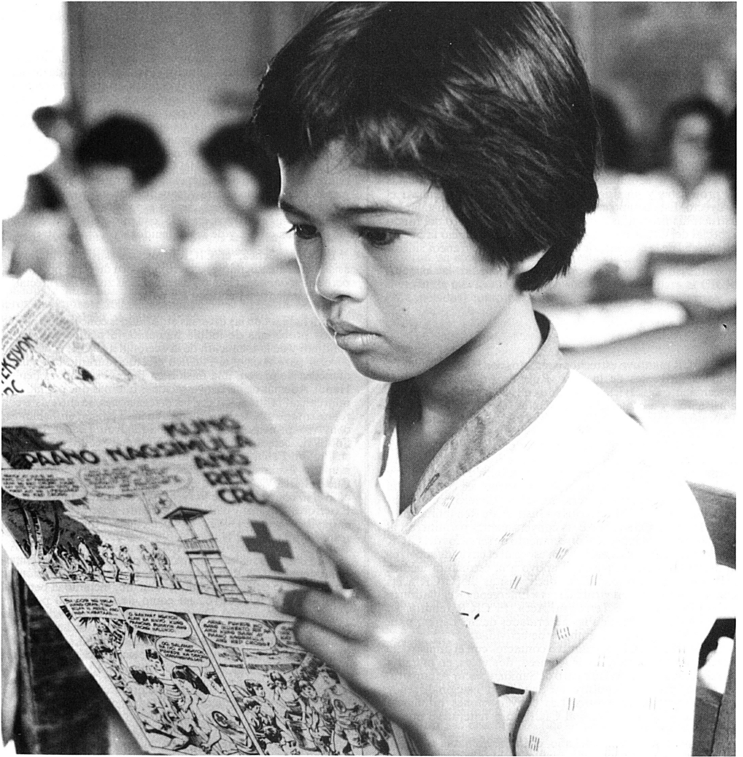
Difusión de los principios de la Cruz Roja por medio de historietas en una escuela de Filipinas.