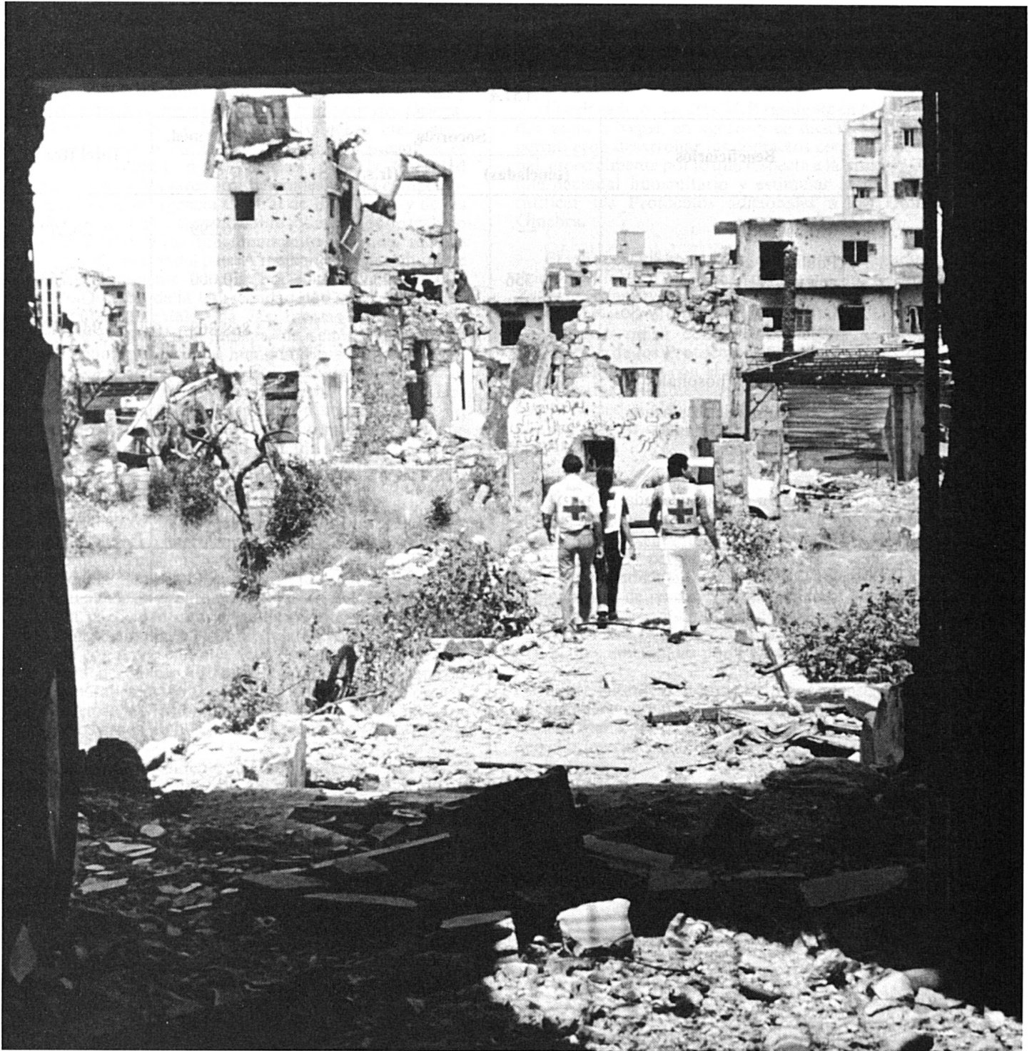
Gira de evaluación en un barrio siniestrado de la periferia de Beirut.