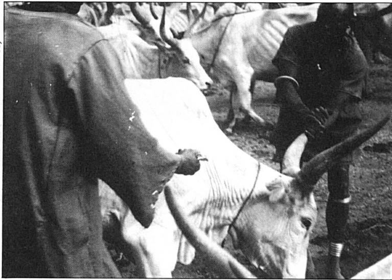
Vacunación del ganado en Sudán meridional.