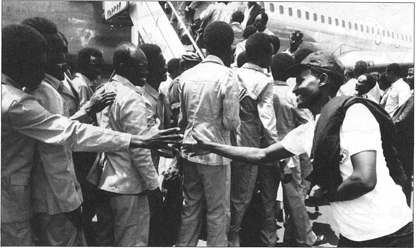
Etiopía/Somalia: repatriación de prisioneros de guerra somalíes.