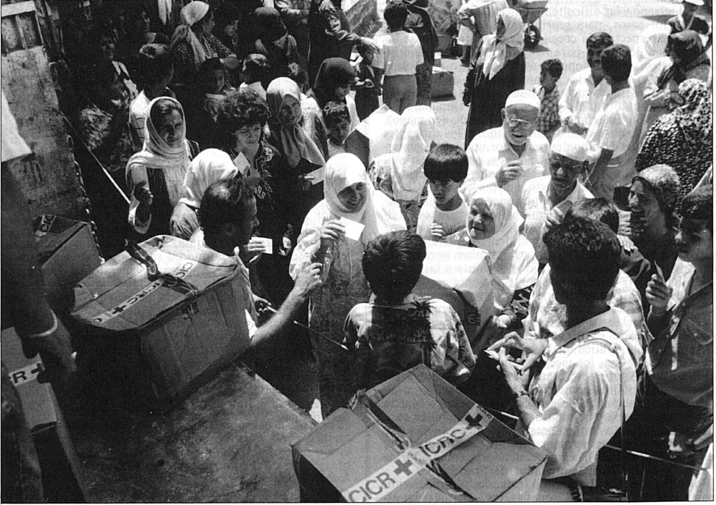
(Fotografía: CICR/A. Hassan — LIBA 89-223/15)