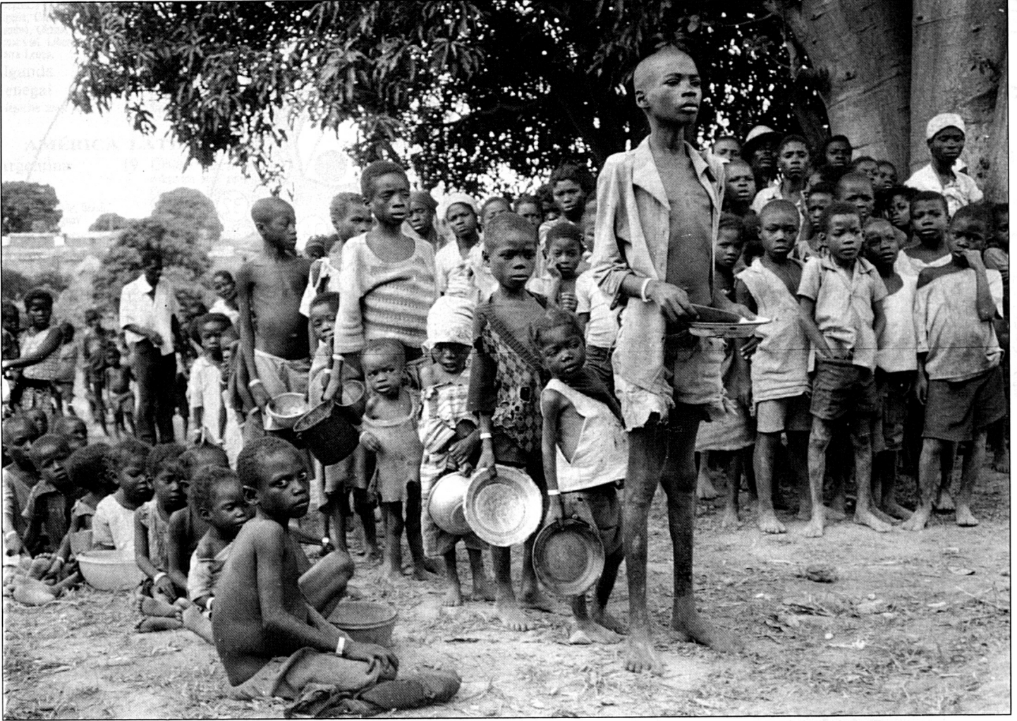
Distribución de víveres en Ganda (Angola).