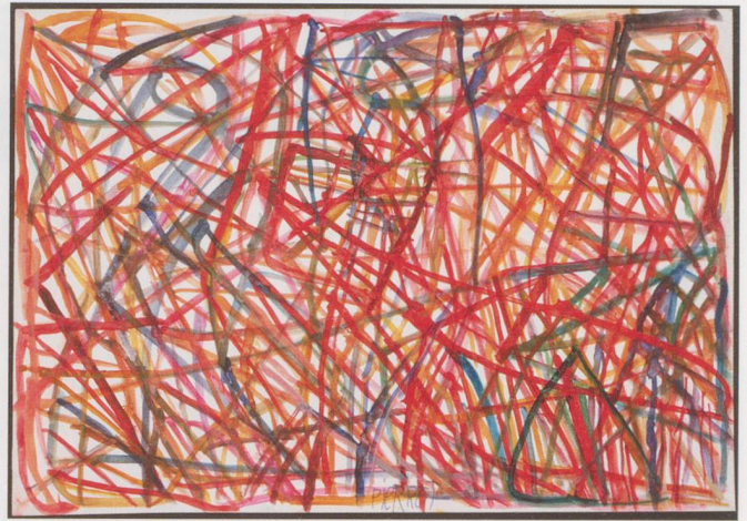
Pierre Garbani, sans titre, entre 1990 et 2001, gouache sur papier, 30 x 50 cm (Collection de l'Art Brut, Lausanne)

a toujours dessiné, enfant déjà, lorsqu'il est placé dans une institution fribourgeoise pour sourds-muets, Le Guintzet, puis adolescent, lorsqu'il retourne dans la ferme familiale. Il y restera jusqu'à 65 ans, avant de rejoindre la Maison St-Joseph où il résidera jusqu'à sa mort, en 2004. «C'est ici que nous avons commencé à conserver ses dessins. Les précédents ont sans doute terminé dans la cheminée de la maison familiale pour alimenter le feu», explique Yves-Alain Repond.