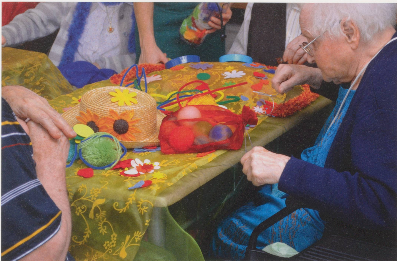
Les Colporteurs'Couleurs s'appuient sur les couleurs pour favoriser la relation.