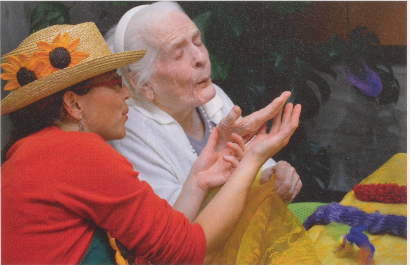
Les objets utilisés sont mis en jeu pour réveiller les sensations encore perceptibles.

ensuite des balles, des pompons, des foulards, des plumes et autres objets colorés, qu'elles proposent aux résidents et qui vont passer de mains en mains, ou finir dans le jardin imaginaire qui prend forme à un bout de la table. Pour leur part, les deux «jardinières» discutent, posent des questions, plaisantent, chantent, écoutent aussi, au passage ramassent une