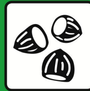
Noix | Fruits secs | Farine