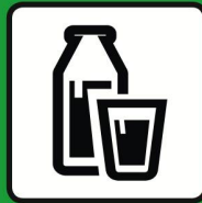
Produits laitiers réfrigérés