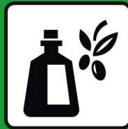
Huiles | Champignons