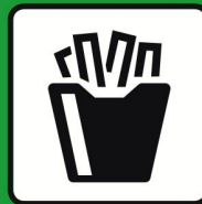
Produits à base de pommes de terre, surgelés