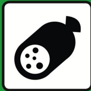
Charcuterie | Saucisses réfrigérées