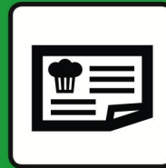
Articles de papèterie | Articles usuels divers

Plus de 100 super offres vous attendent: www.pistor.ch/pistorprofit