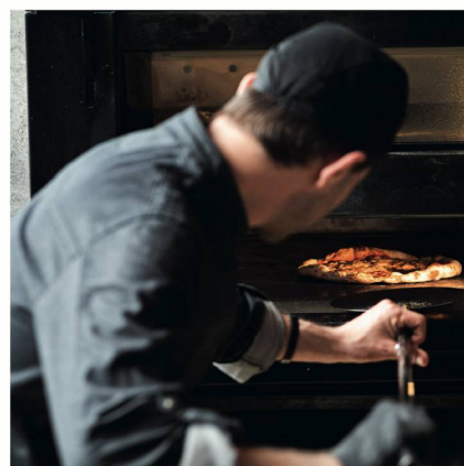
Miam, ... une pizza tout juste sortie du four.

Découvrez d'autres avantages de ce partenariat et comment vous pouvez devenir encore plus performant: pistor.ch/fr/wuest