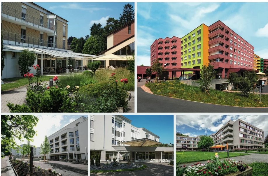
Viva Luzern regroupe cinq établissements totalisant 900 lits: grâce au modèle Intercare, les soignants ont gagné en assurance.

« Les réactions sont unanimes positives malgré la charge en temps et en ressources. »