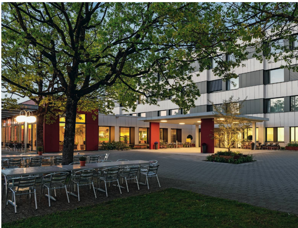
Reusspark à Niederwil: avec l'étude Intercare, l'établissement prévoit aussi un modèle spécifique pour combler le manque de gériatres.