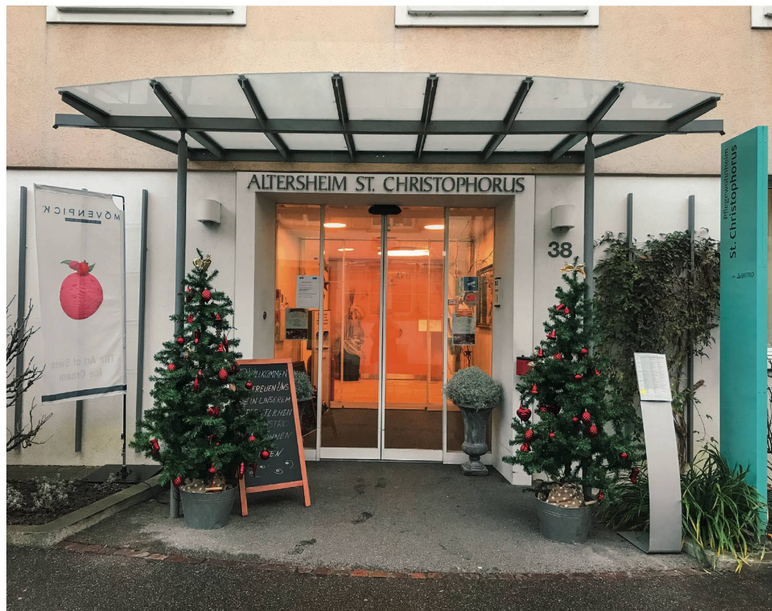
À l'EMS St. Christophorus à Bâle: un établissement de 68 lits et un élan visionnaire de la direction et de l'équipe.