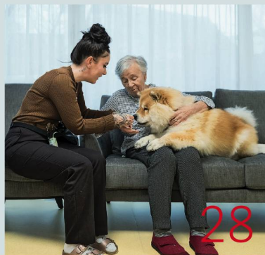
Prise en charge du grand âge