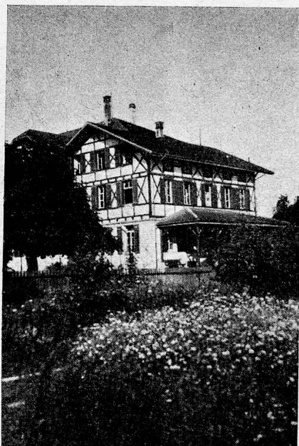
Zürch. Pestalozzistiftung Schlieren