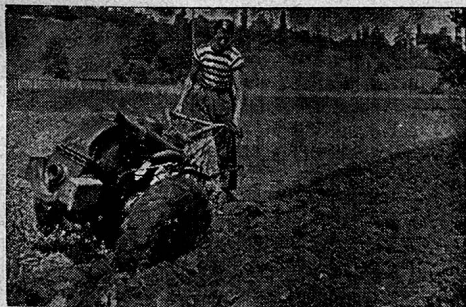
Typen 1945: 4, 8 und 10 PS.

FR. SAUTER/A.G., Fabrik elektr. Apparate, BASEL