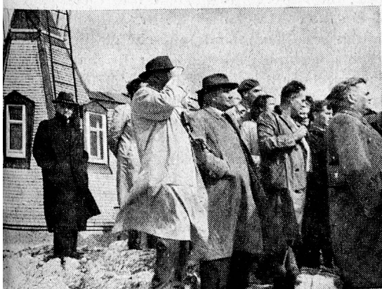
Geographiestunde auf dem Säntisgipfel