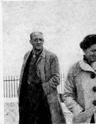
D. Q. R. und J. Mulock Hou Amersfoort. — Trotz Konzeptionslager ungebeugt