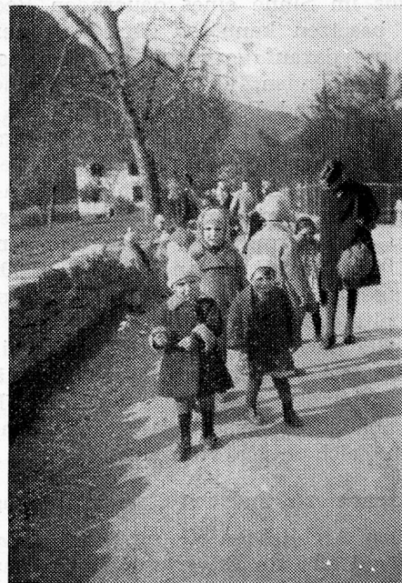
Auf dem Spaziergang

Expertenkommission vorgelegt. Diese anerkannte die Notwendigkeit eines Ausbaues und die mit der geplanten Erweiterung verbundenen Schwierigkeiten. Sie befürwortete die Schaffung eines abgesonderten Baues für die Kleinkinder-Abteilung. Die Wahl des Architekten fiel auf G. Brunold sen., Arosa, der dort bereits eine ähnliche Aufgabe, den Bau des Kinderhauses der Bündner Heilstätte, mit Erfolg gelöst hatte. Ein Ausbau konnte aber nur in Frage kommen, wenn sich ausserkantonale Nutzniesser gegen Einräumung besonderer Ansprüche zu einer finanziellen Beteiligung bereiterklärten. Nach gründlicher Abklärung aller Fragen erklärte sich die Stadt Zürich