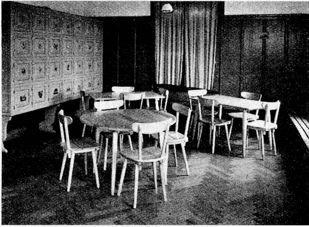
Möbel der «Wohnhilfe» Zürich, im Spielraum des Erziehungsheimes Mauren

der günstigen Preise, für die grössten Mädchen auch einige Schränke angeschafft werden konnten. Diese seien recht stolz darauf, und tatsächlich herrschte in den Schränken, die mir ihrer Form und ihres schönen schlichten Tannenholzes wegen sehr gefielen, eine gute Ordnung. Ein Schrank war durch wenige Schnitzereien, ein anderer durch eine hübsche Bemalung individuell gestaltet.