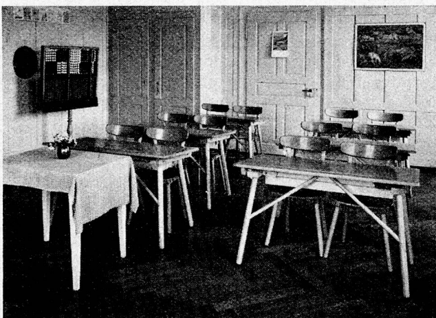
Schulmöbel der «Wohnhilfe» Zürich, in einem Klassenzimmer des Erziehungsheimes Mauren (Möbel für die Kleinen)

Vom Korridor her drang plötzlich Lärm. «Pause», erklärte der Hausvater. «Da könnten wir noch einen Blick ins Schulzimmer werfen», womit ich natürlich gerne einverstanden war, denn ich war wirklich gespannt, ob ich auch hier eine neuartige Einrichtung antreffen würde. «Wundervoll», entfuhr es mir beim Anblick der neuen schönen Zweiertische. «Aber, sind sie nicht zu leicht?» «Nein, wir machen die besten Erfahrungen», gab mir der Heimlehrer zurück. Es ist schon so, als ob die neuen Tische die Schüler, im Gegensatz zu den schweren, alten und mit Eisen beschlagenen, die wir vorher hatten, gar nicht mehr reizten, ihre Kraft zu probieren. Meine ursprünglichen Bedenken haben sich als falsch erwiesen. Zudem können wir die neuen Tische je nach der Arbeit ohne Lärm anders gruppieren