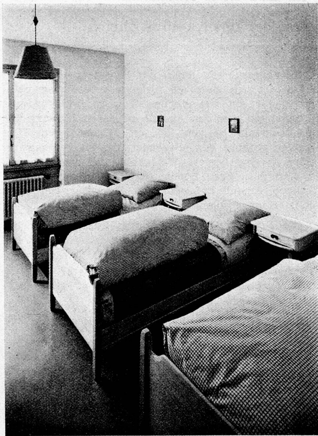
Schlafzimmer im Kinderheim Emmen