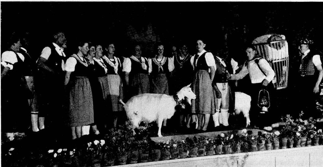
Aus den Darbietungen am Appenzeller Abend im Casino Herisau