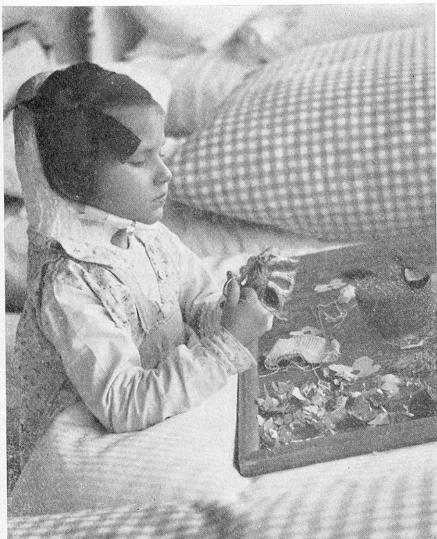
Junge Patientin in der Heilstätte Clavadel

Wir haben im Vorjahr auf den Unterschied in der Besetzung unserer beiden Heilstätten und den Rückgang in der Belegung hingewiesen, der sich vor allem bei unserem Betrieb in Clavadel zeigt. Wald wies im Februar 1959 eine maximale Besetzung von 95,1 % (gegen 100,7 % im gleichen Monat des Vorjahres) und eine durchschnittliche Bettenbeanspruchung von 92,5 % auf (1958 97,3 %). Die Abnahme entfällt auf die Pflegetage der Kinder, die von 15,4 % auf 11,8 % gesunken sind. Das Kinderhaus war denn auch im Durchschnitt mit nur 70 %, im letzten Quartal 1959 noch mit 55 % besetzt. Erheblich tiefer liegen die Zahlen von Clavadel (maximale Besetzung im Februar 89,5 %, im Jahresmittel aber nur 75 % und im Dezember 1959 sogar nur 53 %). Da unsere Stiftung seit dem Jahr 1896 die Führung im Kampf gegen die Volksseuche der Tuberkulose im Kanton Zürich innehat, freuen wir uns über die Erfolge, die als Frucht einer von zwei Generationen in gemeinnützigem Geist geübten Tätigkeit betrachtet werden dürfen. Im Hinblick auf die Mittel, die seit Kriegsende unseren Aerzten zur Verfügung stehen, und die vorbeugenden Massnahmen, die beim Zürchervolk weitgehendem Verständnis begegnen, sehen wir für die Zukunft ein ferneres Abgleiten der Nachfrage nach Tbc-Sanatoriumsbetten voraus. Die Frage nach dem