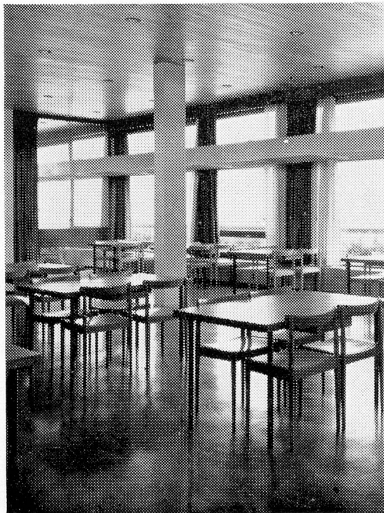
Blick in den gepflegten Speisesaal

Dass der gute Geist, der das heutige Heimleben beseelt, für alle Zukunft über dem Hause herrschen möge, das ist der Wunsch der Behörden und der Bevölkerung von Emmen!