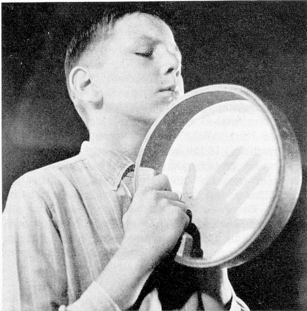
Das Lebensgefühl des taubstummen Schülers wird durch den Rhythmikunterricht bereichert. Zwar hört er die Musik nicht; er lernt aber die Schwingungen der Töne und ihren Rhythmus fühlen.

losen nicht im Sinne von «armen Tröpfchen» zu sprechen. Die Lehrkräfte an der Taubstummenanstalt Wollishofen zeigten in vier ergreifenden Bildern mit ihren Schützlingen, welche unendliche Mühe und Sorgfalt für den Aufbau der Sprache beim gehörlosen Menschen aufgewendet werden müssen. Wie beglückt ist jede Mutter über das erste Wort ihres Kindes. Nicht weniger jedoch ist es der Taubstummenlehrer, wenn es ihm gelungen ist, seinen Schützling so weit zu fördern, dass er sein erstes Wort spricht. Wir Hörende können uns kaum genügend vorstellen, was es heisst, eine Sprache ohne Ohr (Gehör) aufzubauen. In dieser Arbeit muss das Auge (Ablesen), müssen Verständnis und exakte Kontrolle des gesprochenen Wortes das Ohr ersetzen. Das taubstumme Kind trägt in sich die Bereitschaft zu sprechen. Kleine vorhandene Hörreste genügen niemals, um die Sprache aufzunehmen, aber sie erleichtern die Aufnahme und ermöglichen eine deutlichere und klangvollere Sprache. Die Darbietungen mit Schülern waren gerade in dieser Hinsicht ungemein aufschlussreich und eindrucklich.