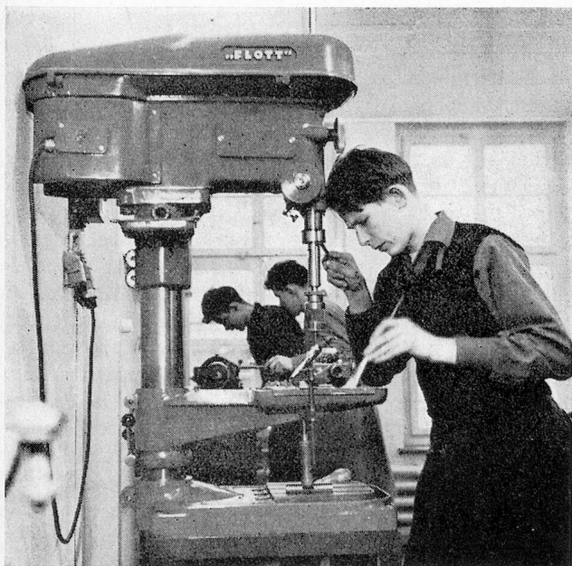
In der gut eingerichteten Anlehrwerkstätte

Am 30. Januar 1962 beschloss der Stiftungsrat, das Unterhaus zu renovieren und umzubauen. Es wurde im Jahre 1953/54, als die Burg umgebaut und das Schulhaus angebaut wurde, nicht erneuert. Das Haus war etwas baufällig. Das Dach musste repariert werden und die im oberen Stock untergebrachten Räumlichkeiten waren feuergefährlich. Es musste eine Aenderung vorgenommen werden. Die Grundidee beim Umbau war: 1. die Trennung der beiden Gruppen, 2. Schaffung neuer Wohnmöglichkeiten für Mitarbeiter, 3. der Ausbau der Garderobe und Eingangsräumlichkeiten in der Turnhalle und 4. Renovation der Anlehrwerkstätte. Unser Gesuch an den Regierungsrat und die Invalidenversicherung wurde im Frühjahr 1962 eingereicht. Die Invaliden-Versicherung sicherte uns eine Unterstützung zu und der Regierungsrat bewilligte im Prinzip das Projekt und die Subventionierung. Der Vorschlag des