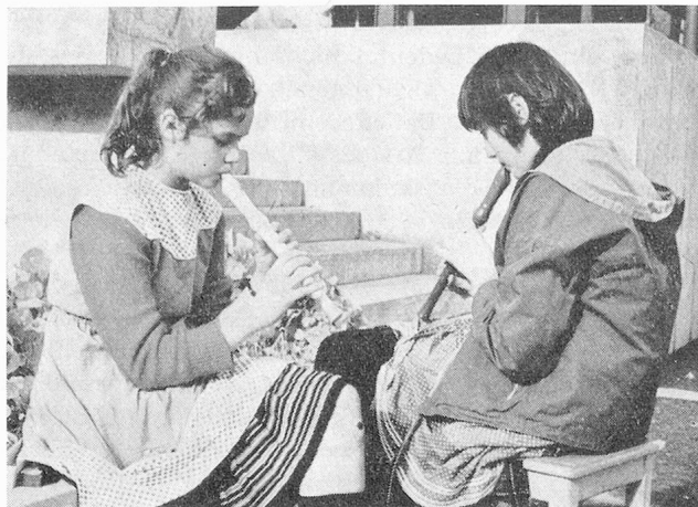
Im Mädchen-Erziehungsheim Röserental Liestal

Und nun zu den Kindern, deren Grundbedürfnisse im Bejaht- und Geliebtwerden bestehen, deren Selbstgefühl durch Leistungen, die ihrem Wesen entsprechen,