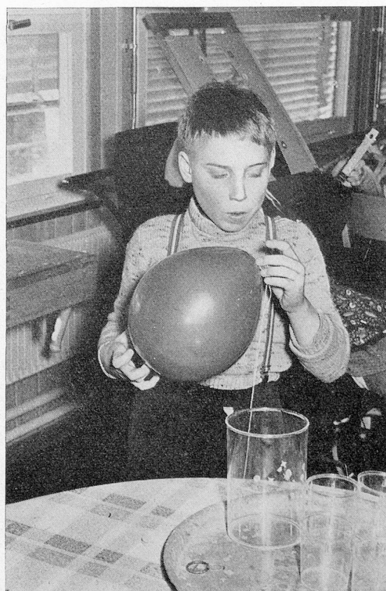
14jähriger in der Zürcherischen Pflegeanstalt für geistesschwache, bildungsunfähige Kinder in Uster

Vier oder fünf Generationen haben in den letzten 120 Jahren an dem Werk mitgearbeitet. Aber nur wenige davon arbeiten in der zweiten oder dritten Generation am gleichen oder ähnlichen Werk. Eine «Berufsvererbung» oder Berufstradition, die vom Vater auf die Kinder übertragen wird, ist selten. Von Aussenstehenden