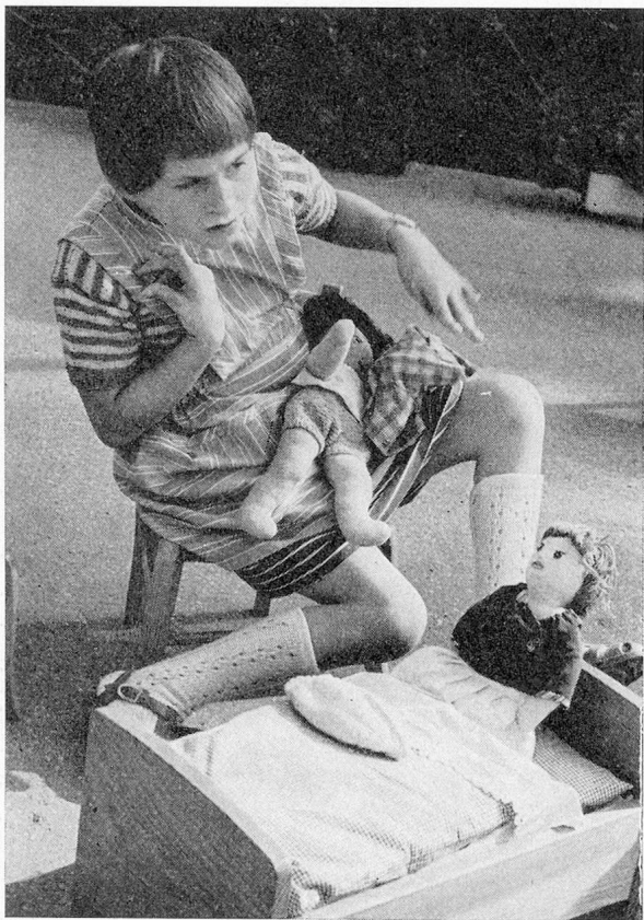
Cerebral gelähmtes Kind im Gebrechlichenheim Kronbühl SG

Um die spezifischen familiären Verhältnisse einer Heimleiter- bzw. Heimerzieherfamilie klarer zu sehen, möchte