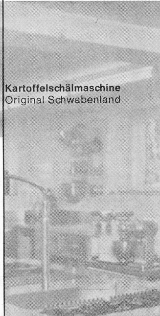
Kartoffelschälmaschine Original Schwabenland