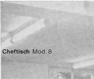
Cheftisch Mod. 8

Wir übernehmen die Planung und Ausführung kompletter Küchen- und Kantinen- Einrichtungen.