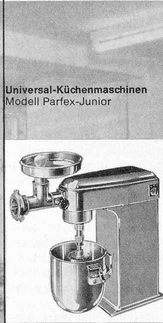
Universal-Küchenmaschinen Modell Parfex-Junior