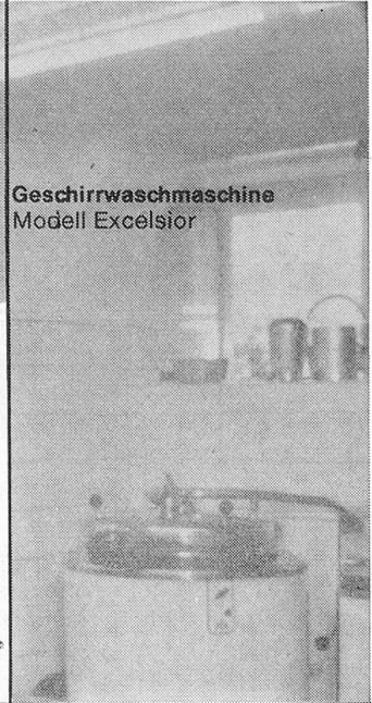
Geschirrwashmaschine Modell Excelsior