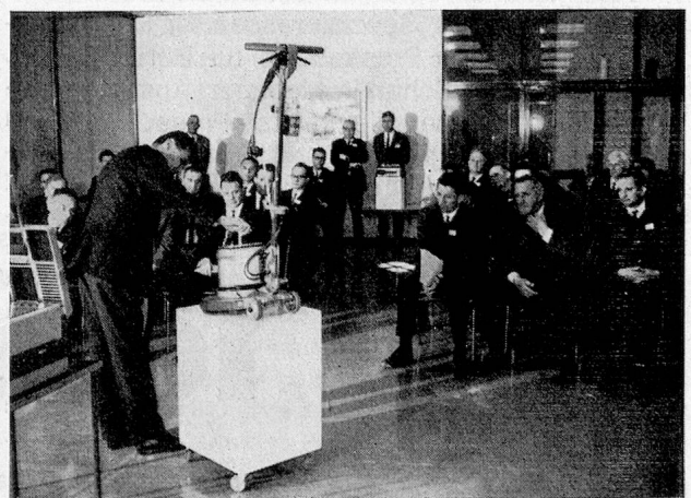
Demonstrationen im Schulungszentrum