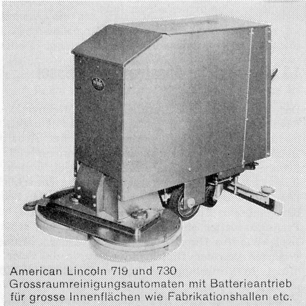
American Lincoln 719 und 730 Grossraumreinigungsautomaten mit Batterieantrieb für grosse Innenflächen wie Fabrikationshallen etc.