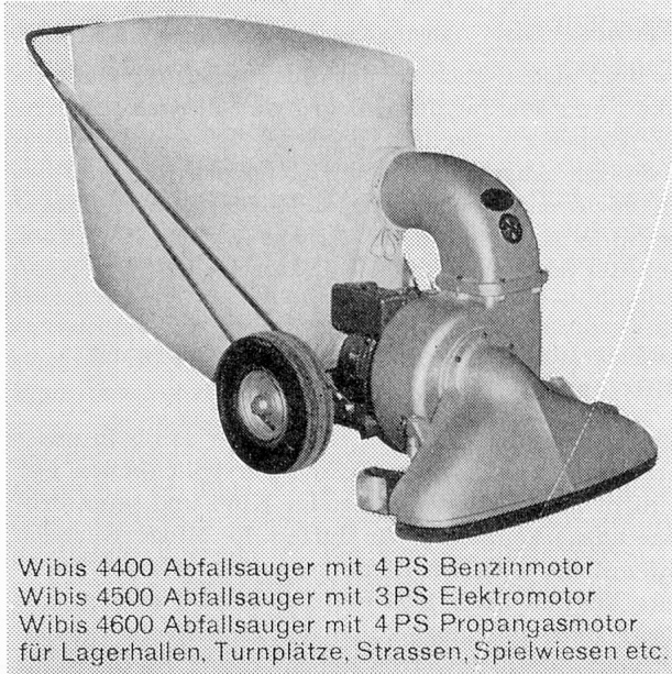
Wibis 4400 Abfallsauger mit 4 PS Benzinmotor Wibis 4500 Abfallsauger mit 3 PS Elektromotor Wibis 4600 Abfallsauger mit 4 PS Propangasmotor für Lagerhallen, Turnplätze, Strassen, Spielwiesen etc.

Besuchen Sie uns an der MUBA 1967, Halle 8a, Stand 3148