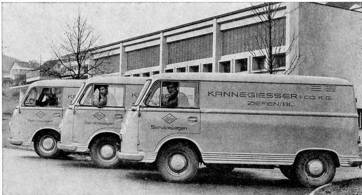
Kannegiesser-Servicewagen vor unserem Werk in Ziefen BL

Es genügt heute nicht, gute Maschinen zu bauen. Auch die zuverlässigste Maschine versagt einmal ihren Dienst. Wichtig ist, sie schnell wieder einsatzfähig zu machen. Dafür sorgt unser gut ausgebauter Kundendienst. Jeder Servicewagen hat für gut 20 000 Franken Ersatzteile an Bord. Unsere Servicemonteurs wurden monatelang an unseren Maschinen ausgebildet.