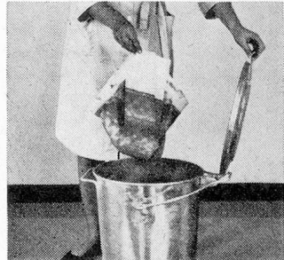
Hier einige Beispiele aus dem umfassenden Servo-Wetrok-Programm:

Die Verwaltung. («Wir haben weniger Personalsorgen – und weniger Reinigungskosten!») Die Ärzte. («Wirklich ein Optimum an Sauberkeit und Hygiene!») Das Personal. («Die Reinigungsarbeit lässt sich schneller, müheloser und auf hygienischere Art erledigen.»)