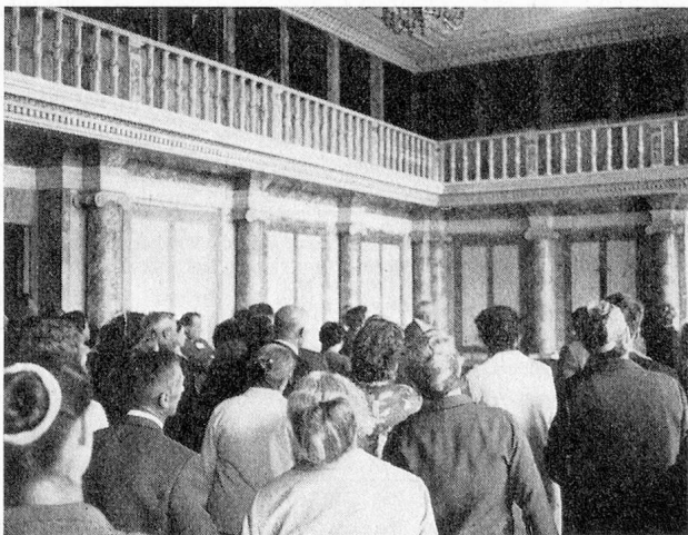
Eines der schönsten Zellweger-Häuser ist das Rathaus: Hier der Obergerichtssaal

Im Namen des Regierungsrates gratulierte und dankte Regierungsrat R. Höhener den Hauseltern für Arbeit und treue Dienste. Als Gemeindedirektor habe er, wie er sagte, in den Jugend- und Bürgerheimen, weil nicht nötig, nur sehr wenige Inspektionen durchgeführt. Er wisse gut genug und freue sich darüber, dass in den Heimen weder Ordnung noch Pflege und Betreuung der Insassen zu beanstanden seien. Die Zellweger-Ueberlieferung sei ein Beweis dafür, dass im Kanton Appenzell AR das Sozialwesen seit eh und je als förderungswürdig anerkannt werde, und mit dem Kinderdorf Pestalozzi werde eine von Zellweger und seinen