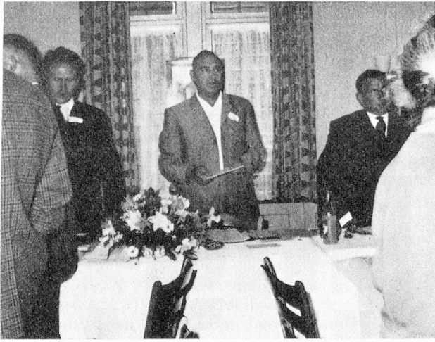
Eröffnungslied — auch am Vorstandstisch wird kräftig gesungen