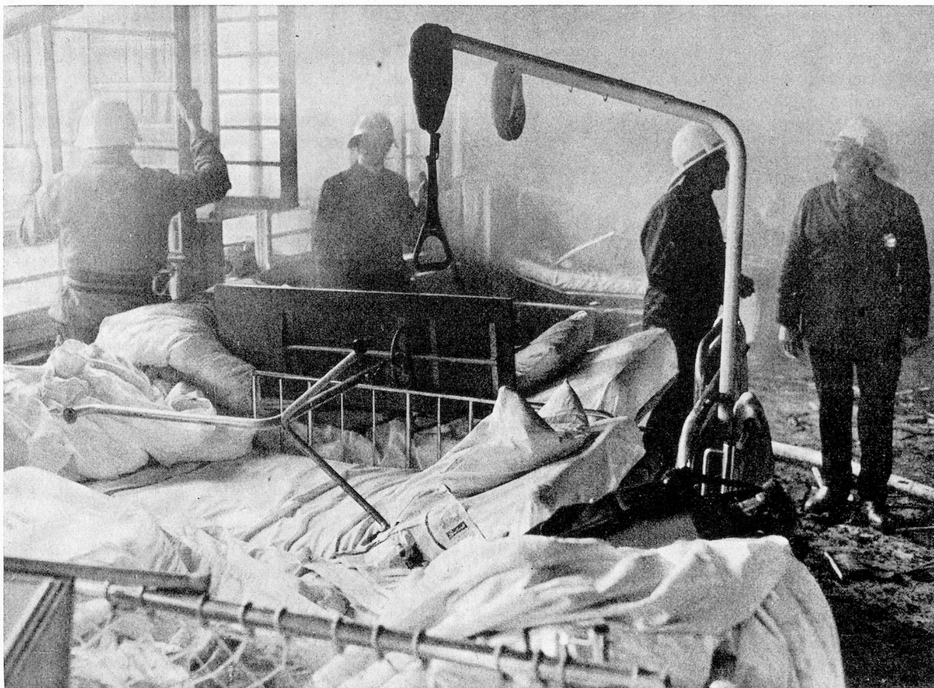
Einer der Schlafräume im Alterstrakt des «Burghölzli», wo im März 1971 ein Brand ausbrach, dem 28 Insassen zum Opfer fielen

Hilfsgeister unermüdlich. Anschläge am schwarzen Brett oder Merkblätter wären auch für diese Menschen nicht sehr zweckmässig.