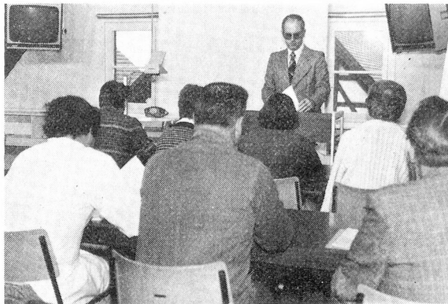
Wie im Neutal gearbeitet wird. Die Problemstellung der Abteilungsleiter wird dem Plenum vorgestellt, durch Gruppen bearbeitet und von Gruppensprechern die Lösung dem Plenum wiederum vorgetragen.

Wie erwähnt, wird der bei der Kaderausbildung vermittelte Wissensstoff anlässlich der wöchentlichen Abteilungsrapporte allen übrigen Mitarbeitern wei-