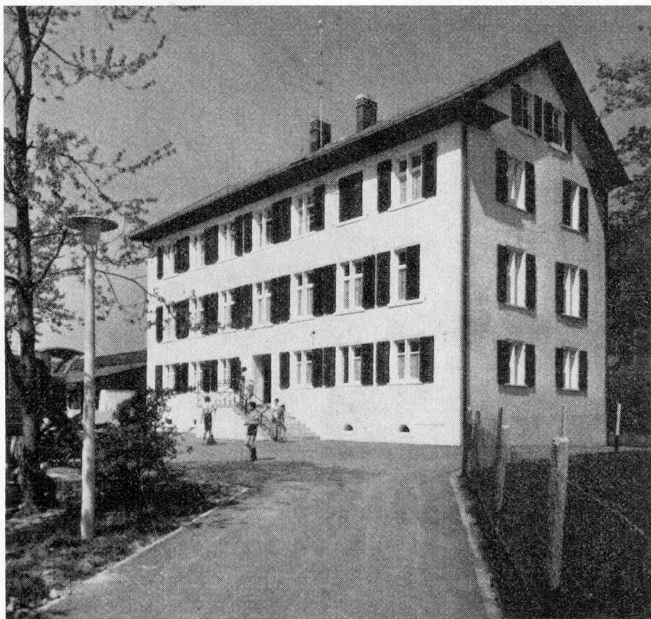
Das Hauptgebäude der 1816 gegründeten Linthkolonie Ziegelbrücke

Der Name verrät, dass das Heim irgendwo im Linthgebiet liegen muss. Weshalb aber der Ausdruck «Kolonie»? 1807 begann der Bau des Linthkanals zur Entsepfung der Linthebene und 1816 war die unter der Leitung von Hans Konrad Escher stehende Arbeit zum Abschluss gebracht. Der neu gewonnene Boden bestand aus Schächten, das heisst aus erhabenen Stellen des alten Linthbettes und bewachsenen Sandbänken, Gräben und Unebenheiten, grösstenteils mit Sauerfutter und Sumpfpflanzen bewachsen. Die «Evangelische Hilfsgesellschaft», 1816 gegründet, bemühte sich, den von Escher angeregten Gedanken zu verwirklichen, in den verwüsteten Landstrichen (27,55 ha) eine Armenkolonie anzulegen und damit die Armenerziehung zu verbinden. 1817 wurde dort etwa 300, zur Hälfte beinahe in der «Kolonie» versorgten, armen Arbeitern Unterhalt und Verdienst geboten.