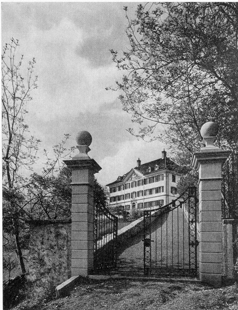
Das wunderbar gelegene Sonderschulheim Haltli in Mollis ist in einem unter Denkmalschutz stehenden Herrenhaus untergebracht.