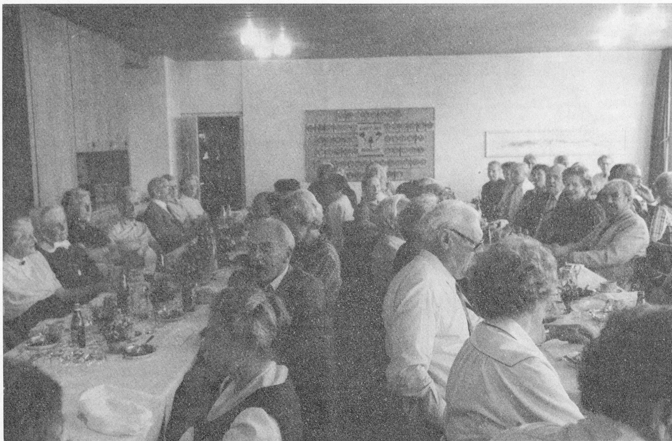
«Wir fühlen uns unabhängig und frei, nur noch dem Herrgott und der Ehefrau untertan, von Neid keine Spur»: Und sie sangen noch eins, eh' sie gingen.

wisheit haben, dass die Veteranen, wo immer sie in Zukunft jedes Jahr zusammenkommen, niemals Hunger und Durst zu leiden brauchen. Gleich nach der Suppe (Bouillon mit Einlage) begrüßte Joachim Eder die Gäste namens des Vorstandes der VSA-Sektion Zentralschweiz. Ein Veteranen-Treffen, meinte er, müsse etwas von der Eigenart und vom